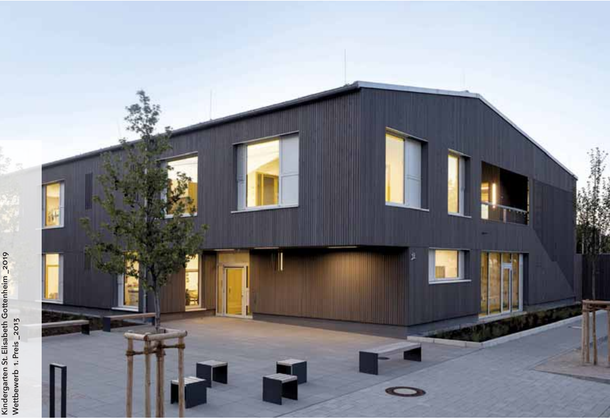
Kindergarten St. Elisabeth Gottenheim _2019 Wettbewerb 1. Preis _2013