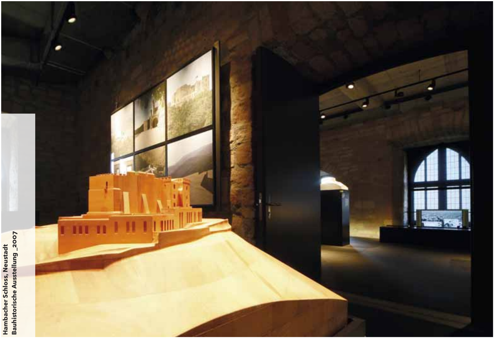
Hambacher Schloss, Neustadt Bauhistorische Ausstellung _2007