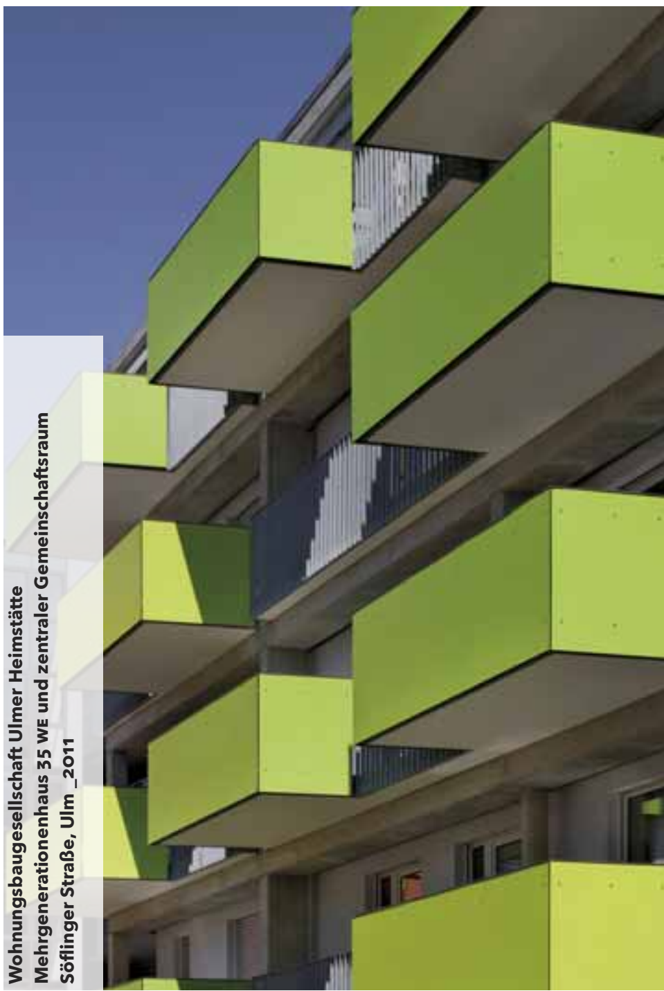
Wohnungsbaugesellschaft Ulmer Heimstätte Mehrgenerationenhaus 35 WE und zentraler Gemeinschaftsraum Söflinger Straße, Ulm _2011