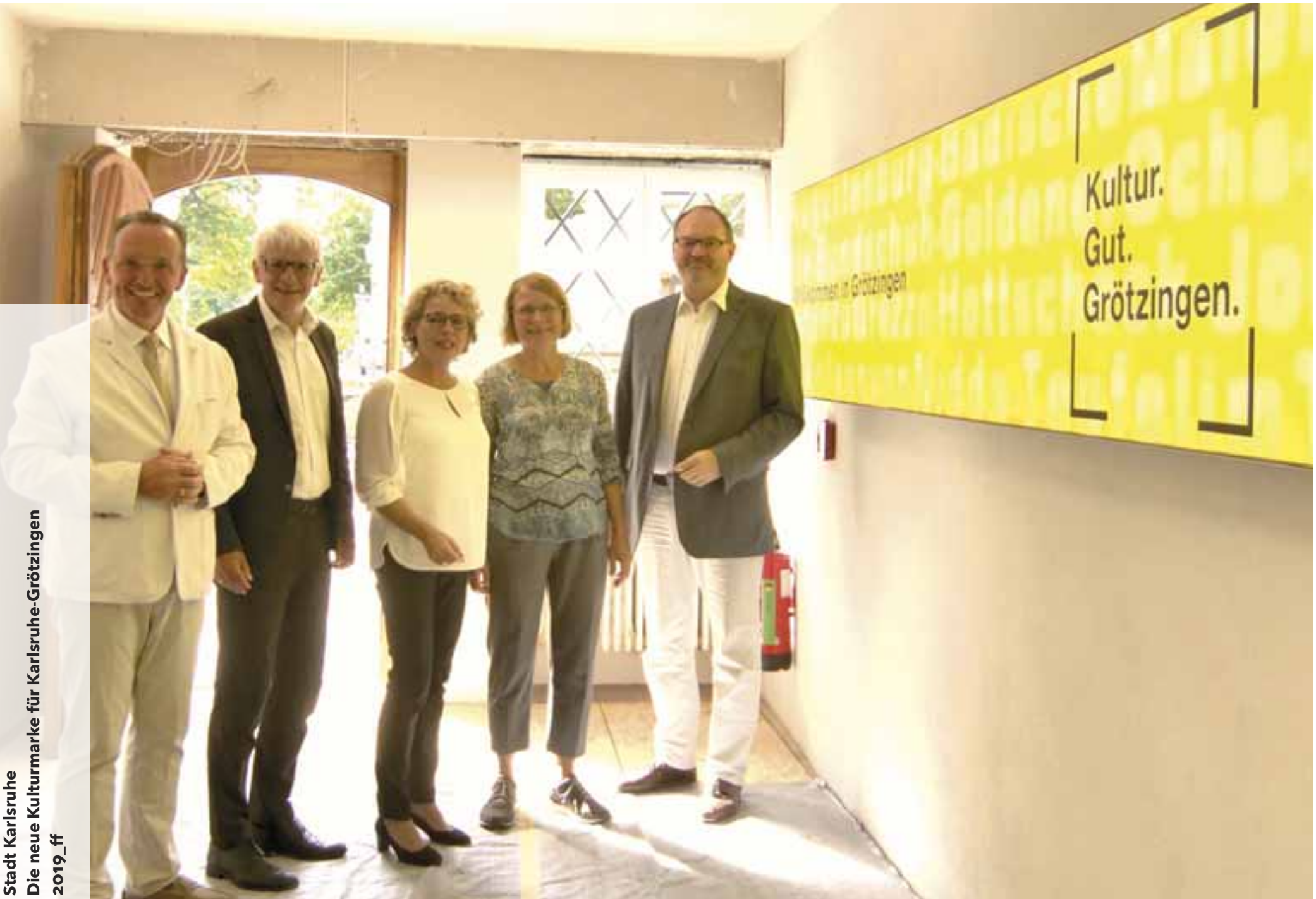
Stadt Karlsruhe Die neue Kulturmarke für Karlsruhe-Grötzingen 2019_ff