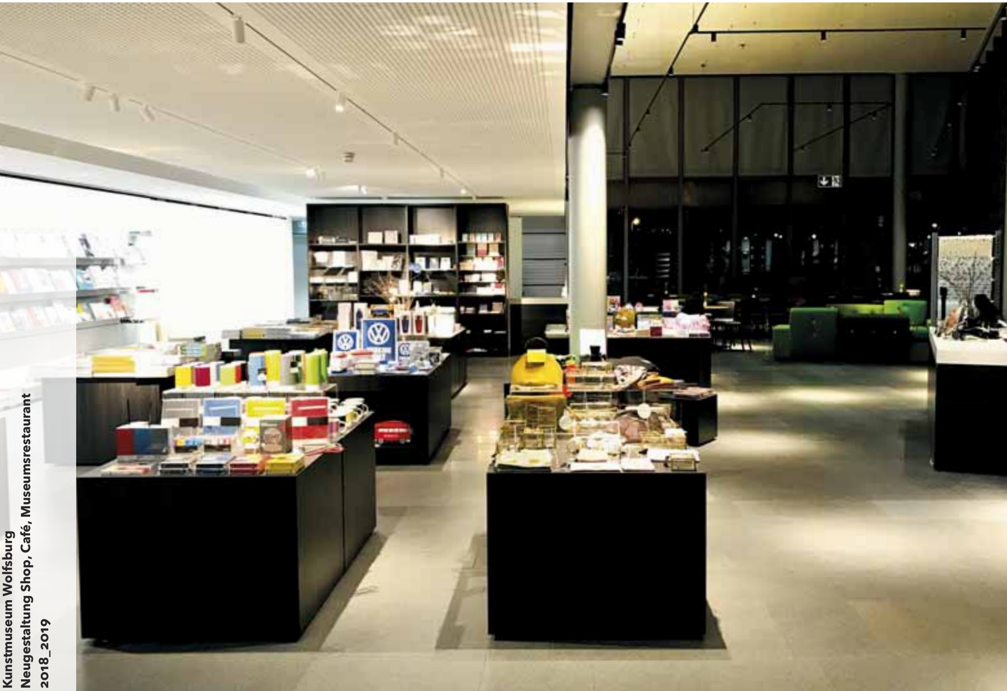
Kunstmuseum Wolfsburg Neugestaltung Shop, Café, Museumsrestaurant 2018_2019