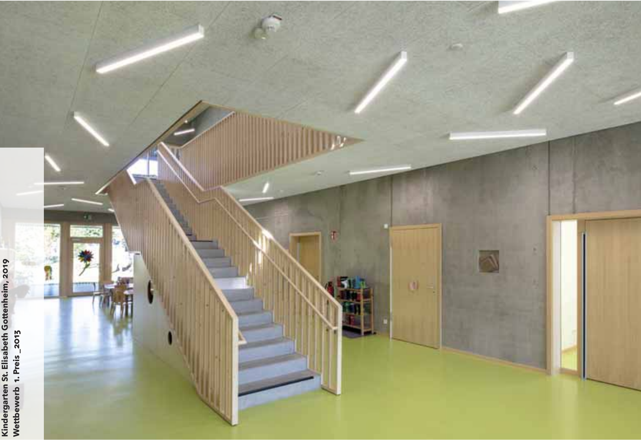
Kindergarten St. Elisabeth Gottenheim, 2019 Wettbewerb 1. Preis_2013